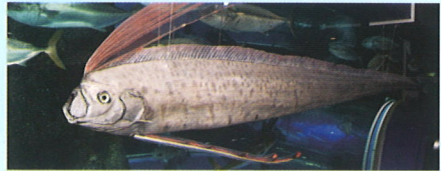
リュウグウノツカイ (はく製)

Check! 富山湾大水槽横にある珍魚リュウグウノツカイ・ダイオウイカのコーナーも見てみよう!