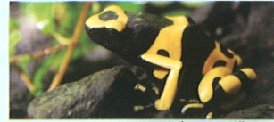
キオビヤドクガエル