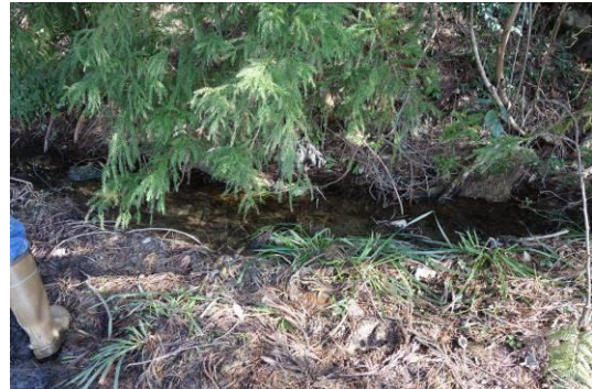
写真4 素掘りの用水路