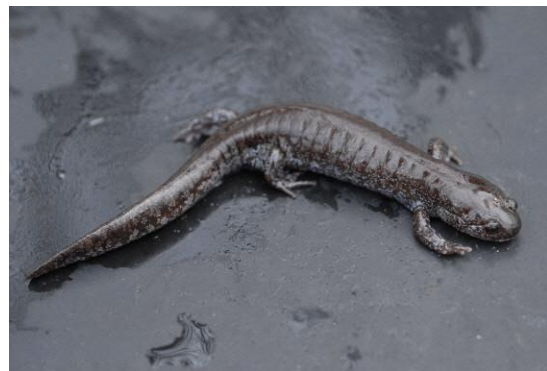
写真 1 ハクバサンショウウオ オス個体