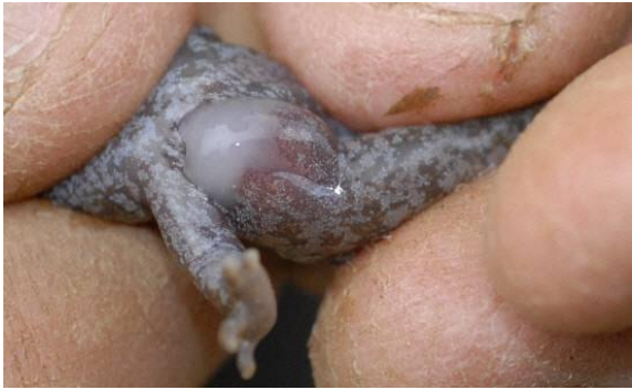
写真3 オス個体の精液