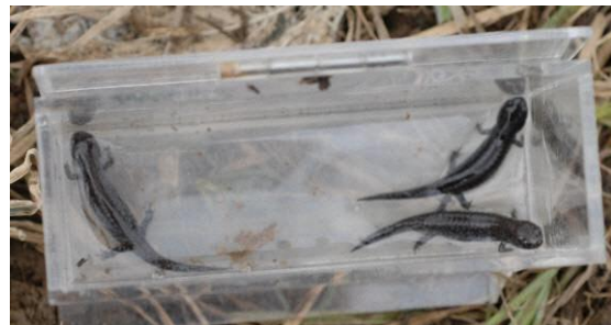
写真 2 幼体 3 個体