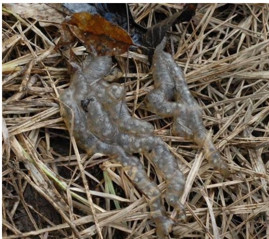
写真5 確認された卵囊