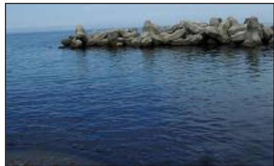
図 2：調査地点の風景

調査は、海況によって出現魚種に差が出たり、濁りによる視界不良を避けるために、なるべく海が穏やかで透視度が高い日の午前中に行った。シュノーケリング、スクーバを用い、波消ブロックからエントリーして沖に向かい、1 周約 130m のコースを反時計まわりに進んだ。その際、目に入った魚種をおおまかな個体数とともに記録し、併せて表層水温を計測した。種の同定は目視によるが、判別が困難な場合は、写真を岡村・尼岡（1997）と照らし合わせて判断した。